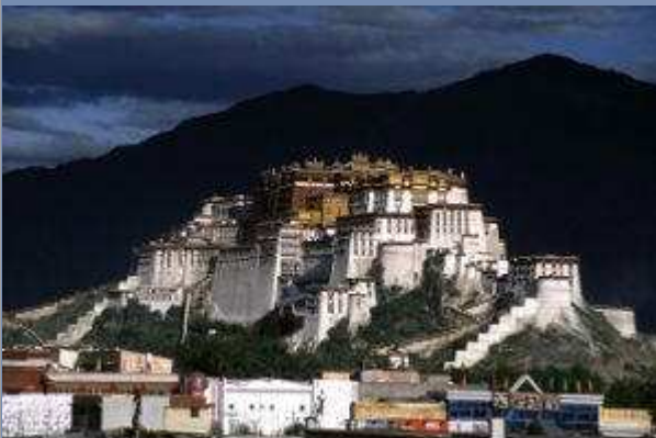
Der Potala: Zwingburg des Dalai Lama

Religionen hatten nicht nur eine enge Beziehung zu Gewalttätigkeiten sondern auch zu ökonomischer Ausbeutung. Tatsächlich ist es oft die ökonomische Ausbeutung, die die Gewalttätigkeiten bedingt. So verhielt es sich bei der tibetischen Theokratie. Bis 1959, als der Dalai Lama immer noch Tibet vorstand, befand sich fast das ganze bewirtschaftbare Land in Großgrundbesitz, auf dem Leibeigene arbeiteten. Diese Güter standen im Besitz von zwei Gruppen: reiche säkulare Fürsten und reiche theokratische Lamas. Sogar ein Autor, der mit der alten Ordnung sympathisiert muß zugeben, daß „ein großer Teil des Grundbesitzes den Klöstern gehörte und die meisten großen Reichtum anhäuften“. Ein großer Teil des Reichtums wurde angehäuft „durch aktive Teilhabe an Handel, Wirtschaft und Geldverleih“.