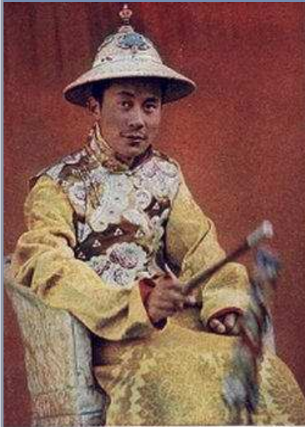
Feudalherr Dalai Lama 1956

Viele Buddhisten glauben, daß das alte Tibet vor den chinesischen Unterdrückungsmaßnahmen 1959 ein spirituell ausgerichtetes Königreich war, das frei war von egoistischer Lebensführung, frei war von Materialismus sowie vom Laster der Korruption, das in westlichen Gesellschaften verbreitet ist. Westliche Medien, Reiseberichte, Novellen und Hollywoodfilme zeigten der Öffentlichkeit die tibetische Theokratie als ein veritables Shangri-La. Der Dalai Lama erklärte, „dass der fortwährende Einfluß des Buddhismus“ in Tibet, „inmitten den Weiten einer unberührten Natur eine Gesellschaft schuf, die sich dem Frieden und der Harmonie verschrieb. Wir genossen Frieden und Zufriedenheit“