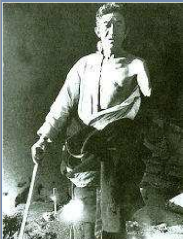
Leibeigener, dem ein Arm abgehackt wurde

Die religiösen Unterweisungen der Theokratie waren ein Eckpfeiler ihrer Klassenherrschaft. Den Armen und Leidgequälten wurde gesagt, daß sie an ihren Problemen selber Schuld seien wegen ihrer Verfehlungen in vergangenen Leben. Sie hatten das Elend ihres gegenwärtigen Lebens als karmische Sühne zu akzeptieren in der Erwartung einer Verbesserung ihres Loses in einem nächsten Leben. Die Reichen und Mächtigen sahen ihr gutes Schicksal als Belohnung an und als unbezweifelbaren Beweis für ihr tugendhaftes vergangenes und gegenwärtiges Leben.